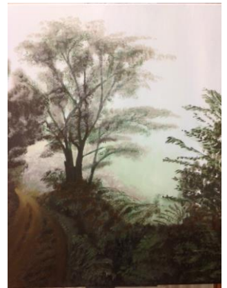
Boom in de mist in Bwambo