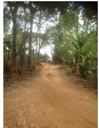
Weggetje in Bwambo